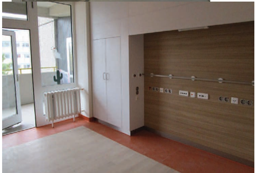
Helle Farben für die Kinderherzstation: ein umgebautes Einzelzimmer.