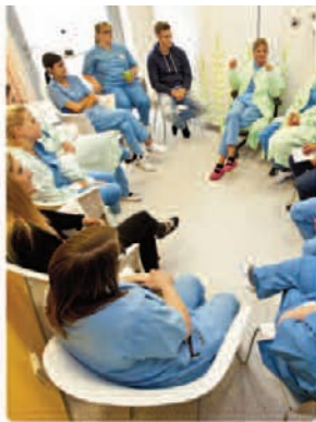
Supervision auf der Kinderinterventionstation der MHH-Kinderklinik. Finanziert durch Kleine Herzen Hannover e.V.