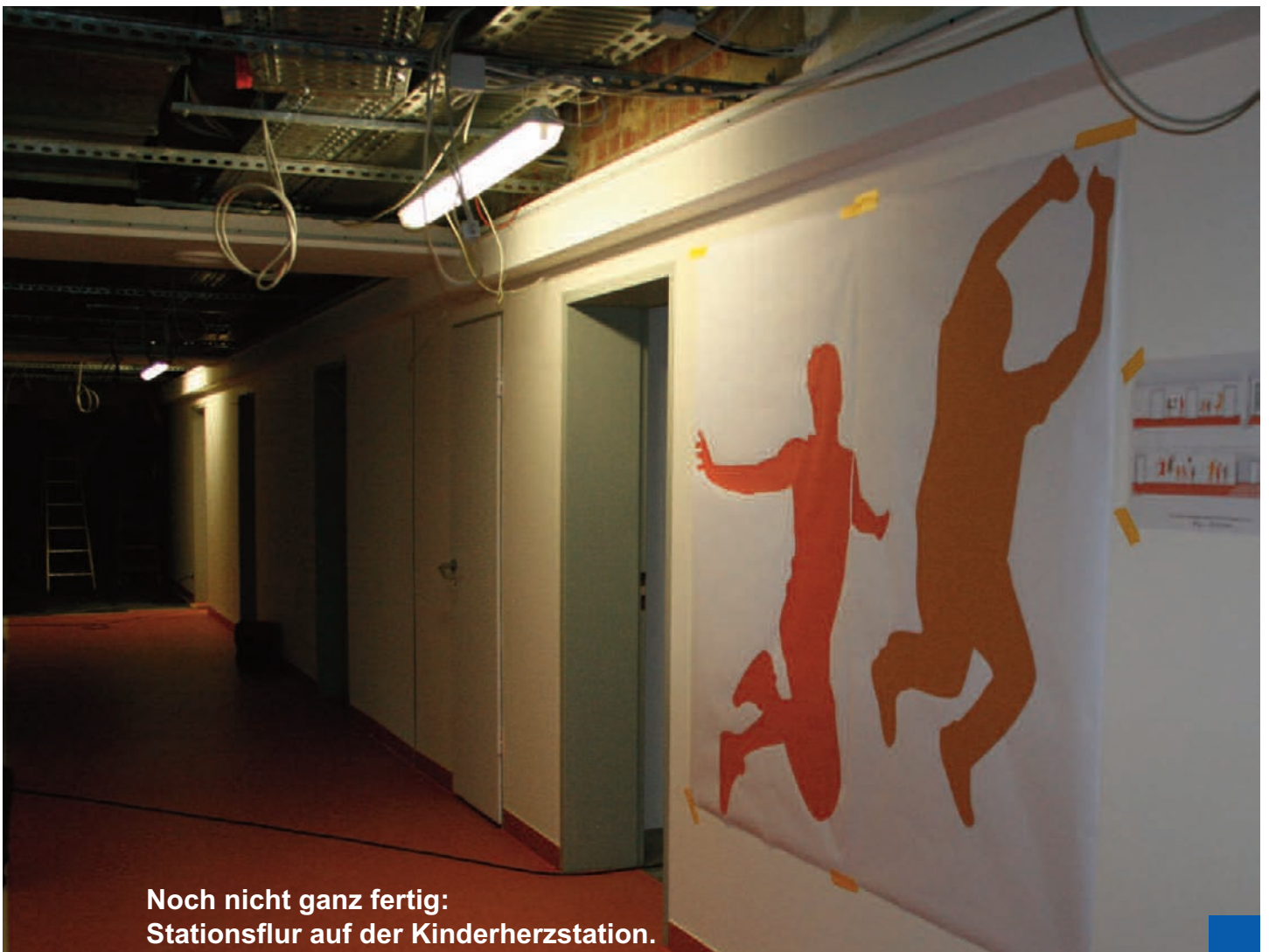
Noch nicht ganz fertig: Stationsflur auf der Kinderherzstation.

Alles mit Hilfe unzähliger Spender und Sponsoren, denen wir an dieser Stelle herzlichst danken!